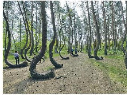
Wyjątkowa przyrodnicza osobliwość – skupisko około 100 zdeformowanych sosen rosnących na obszarze około 0,30 ha.

Wygięcia mają długość od jednego do trzech metrów. Nad łukiem pnie pną się już pionowo do góry. Sosny, pomimo swojego wieku, są