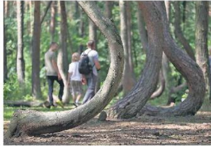
Krzywy Las posadzono najprawdopodobniej w 1934 roku.

„Kurier Szczeciński” pisał o nim wielokrotnie, ale o jego istnieniu wspominały także media z całego świata – w tym brytyjski National Geographic i amerykański New York Times. Brytyjski dziennik Daily Mail zamieścił go na liście 9 najbardziej magicznych lasów na świecie wartych odwiedzenia. Serwis internetowy TaxiZairport.com stworzył zaś listę najcieśniej tagowanych lasów w serwisie społecznościowym Instagram, które powinny się brać pod uwagę w planowaniu wakacyjnych podróży. W gronie 20 lasów znalazły się dwa z Polski: Puszcza Białowieża i Krzywy Las.